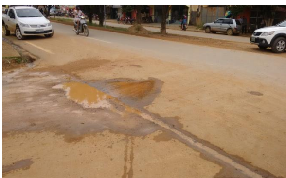
Foto 01: rompimento da tubulação de 50mm de PVC – PBA na rede de distribuição.