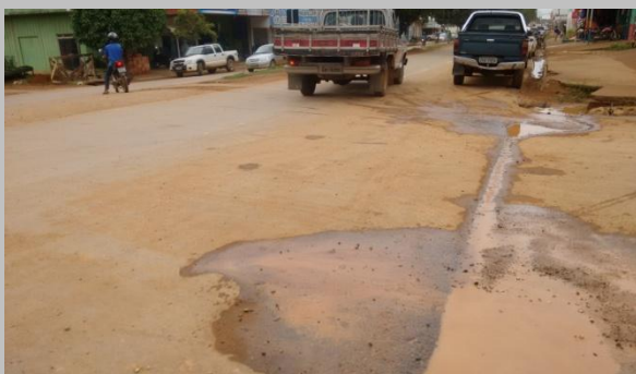
Foto 02: rompimento da tubulação de 50mm de PVC – PBA na rede de distribuição.