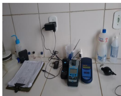
Foto 03: compartimento laboratorial da casa de química; banca com aparelhos para análise da água.