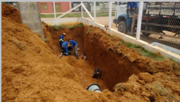
Foto 02: na tubulação de 400mm de FoFo para instalação de Do sensor de vazão.