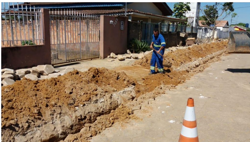
Foto 03: desobstrução das entrada das residência para acesso aos moradores em suas casas.

ESTADO DE RONDÔNIA PREFEITURA DO MUNICÍPIO DE BURITIS AGÊNCIA REGULADORA DE SERVIÇOS PÚBLICOS DELEGADOS DO MUNICÍPIO DE BURITIS AGÊNCIA LEI Nº 870/2014 CNPJ 21738920/0001-81