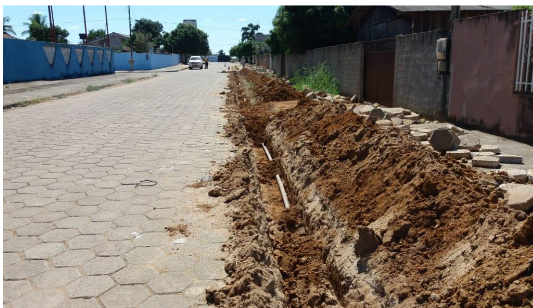
Foto 02: escavação e assentamento de tubulação de 50 mm de PVC PBA na vala.