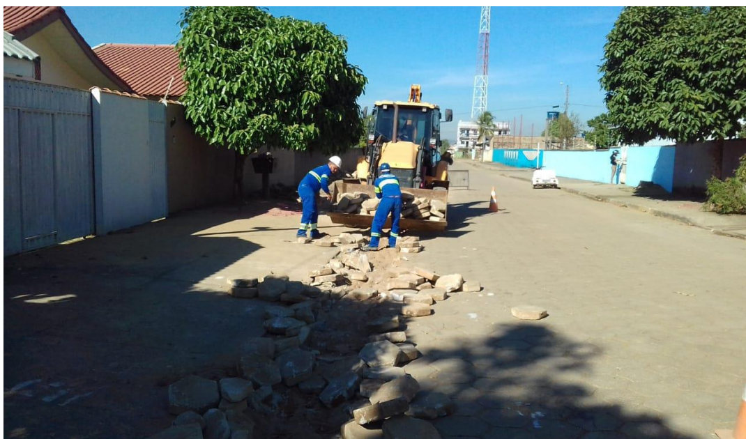
Foto 01: movimentação da pavimentação ( bloquetes) em direção ao Hospital Regional.