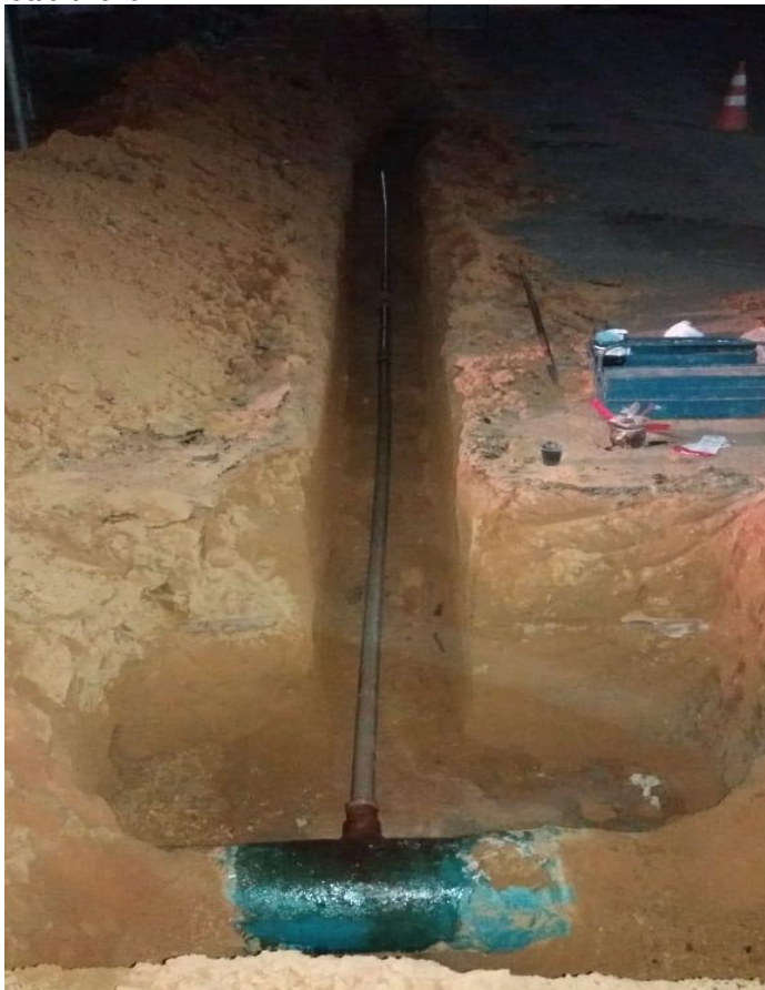
Foto 05: conexão da adutora de DN 300 mm DEFoFo de água tratada à rede de distribuição de DN 50 mm de PVC PBA.