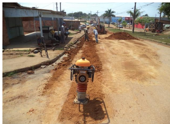
Foto 03: atividades de compactação com material base para recomposição de pavimento.