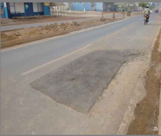
Foto 04: pavimento asfáltico recuperado com CBUQ, com aplicação da massa fria.