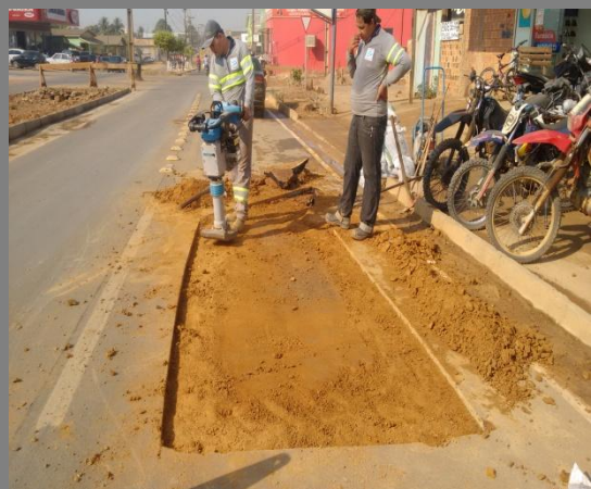
Foto 03: local do rompimento da tubulação de 100mm da rede de água e o momento da recuperação do pavimento asfáltico do local.