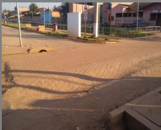
Foto 07: afundamento do pavimento em bloquetes próximo ao CANAL DA CIDADANIA.