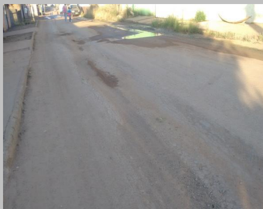
Foto 06: afundamento no asfalto acima da rede adutora devido a má compactação.