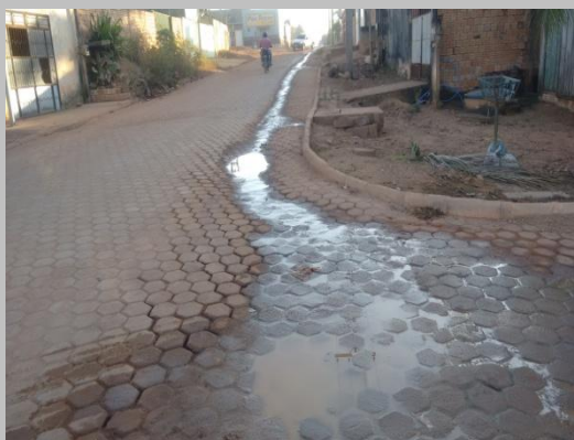
Foto 05: afundamento do pavimento devido a presença de água indevida no local.