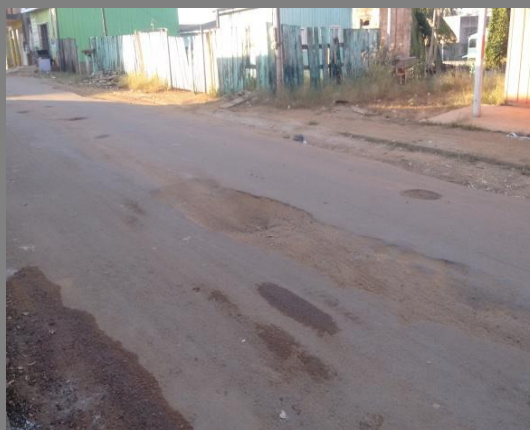
Foto 08: formação de buracos acima da rede de distribuição de água na Rua Cacauplandia.