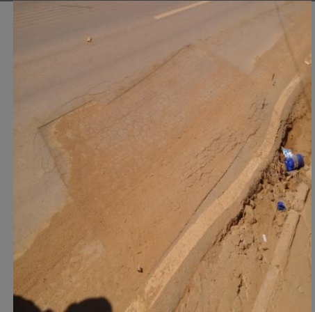
FOTO04:afundamento local e comprometimento da base.