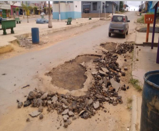
Foto 15: Rua Heleno de Andrade próximo ao hidrante localizado na praça dos caminhoneiros.