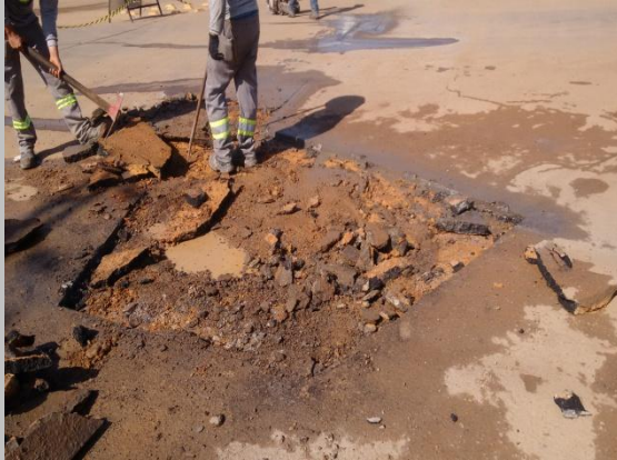
Foto 07: Avenida Ayrton Senna com a Avenida Rondônia em frente ao posto Shell.