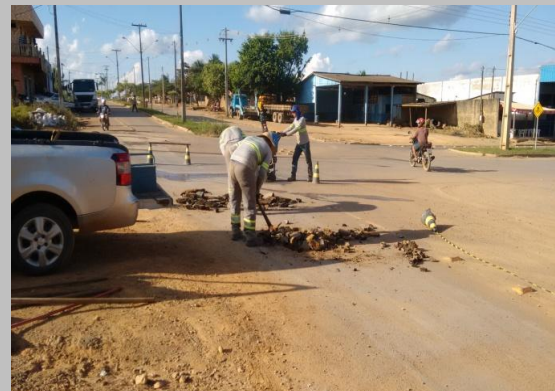
Foto 11: Avenida Ayrton Senna com a Rua Seringueiras em frente ao Posto Shell.