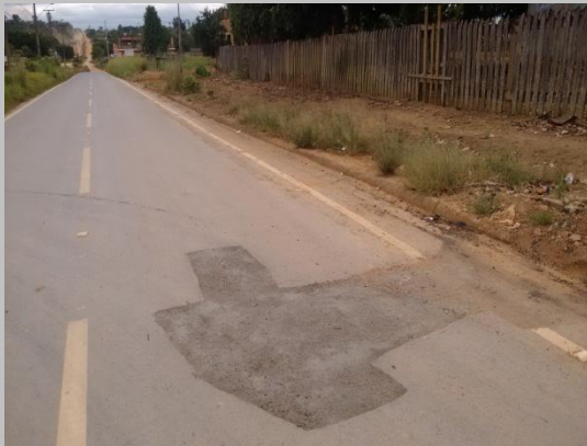
Foto 01: Avenida Porto Velho em frente a Congregação Cristã no Brasil.