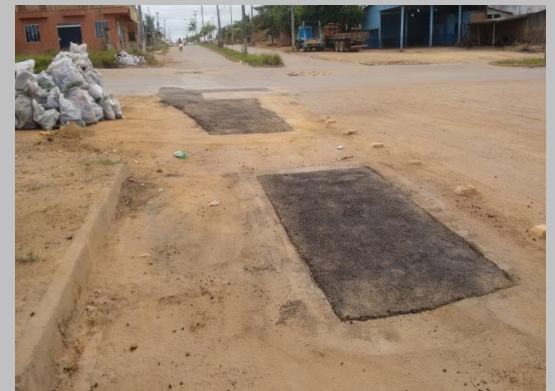
Foto 12: Avenida Ayrton Senna com a Rua Seringueiras em frente ao Posto Shell.