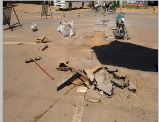
Foto 08: Avenida Ayrton Senna com a Avenida Rondônia em frente ao Posto Shell.