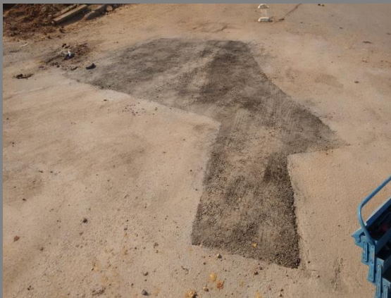
Foto 09: Avenida Ayrton Senna com a Avenida Rondônia em frente ao Posto Shell.