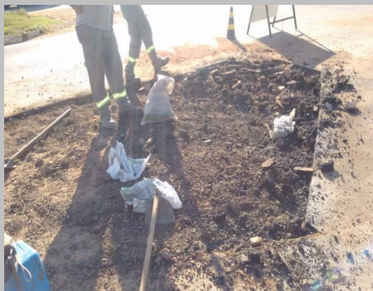
Foto 05: Avenida Porto Velho em frente ao Guaira Smart Supermercado.