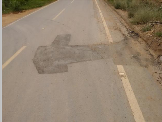
FOTO 01- apresenta afundamento da base.