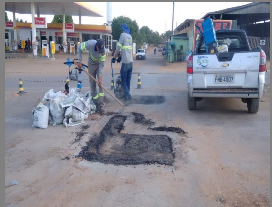
Foto 10: Avenida Ayrton Senna com Avenida Rondônia em frente ao Posto Shell.