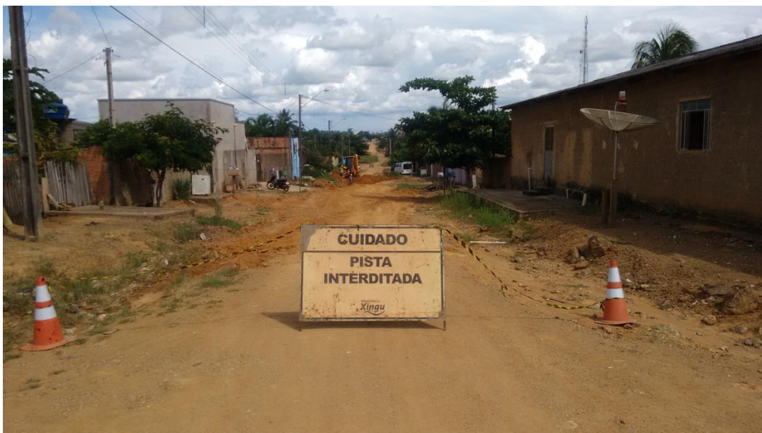
Foto 02: instalação de registro de sistema de rede na Rua Ariquemes.

Foto 01: 24/04/2018 - início das escavações para as extensões redes na Rua Ariquemes no setor 02.