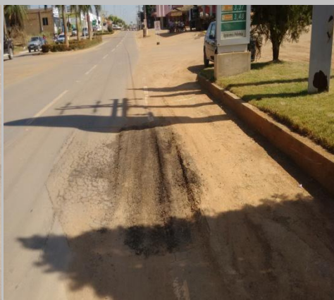
Foto 04: afundamento no local do reparo aparentemente devido a má compactação da base.