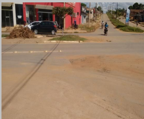
Foto 08: ponto recuperado porem recalado aparentemente devido a má compactação da base, localizado na Avenida Porto Velho com a Avenida Monte Negro.