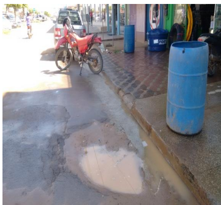
Foto 05: ponto recuperado porem danificado devido o excesso de água na localidade.