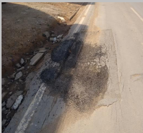
Foto 03: afundamento no local dos reparos aparentemente devido a má compactação da base.