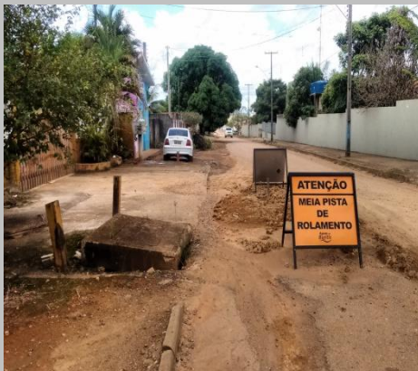
Foto 03: extensão de rede ate a Rua Mirante da Serra com a Rua Cujubim.