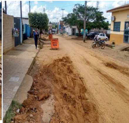
Foto 02: atendimento a Feira Municipal e a Secretaria Municipal de Agricultura – SEMAGRI.