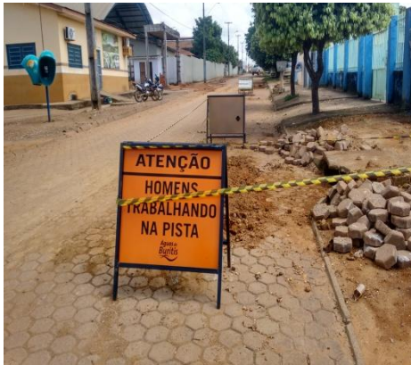
Foto 01: ampliação de rede para o fornecimento de água á Feira Municipal, com o local das atividades devidamente sinalizado e remoção dos bloquetes para o assentamento da tubulação de 50mm de PVC.