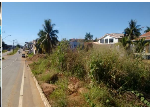
Foto 06: limpeza do terreno em frente ao outdoor, na lateral da Avenida Ayrton Senna.