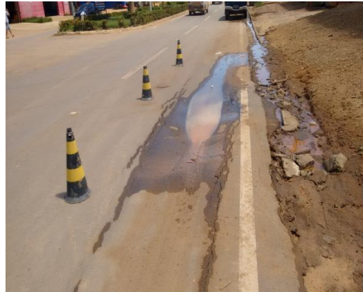
Foto 02: afundamento do asfalto referente ao rompimento de tubulação.