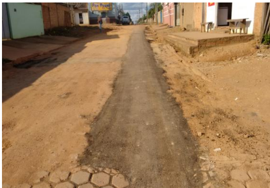
Foto 01: recomposição asfáltica na Rua Alta Floresta com CBUQ com aplicação frio.