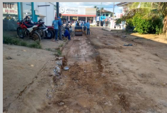
Foto 04: preparação de base e compactação na travessa 09 localizada entre a Rua Helenite Ferreira de Sousa e Avenida Ayrton Senna.