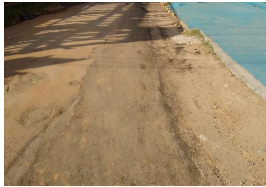
Foto 02: recomposição asfáltica na Rua Alta Floresta depois do Canal da Cidadania, com CBUQ aplicação frio.