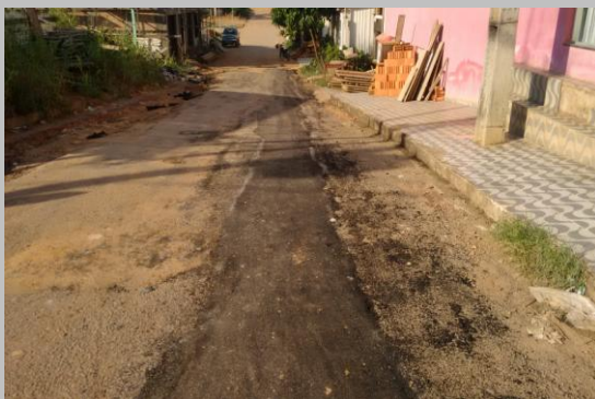
Foto 03: Rua cabixi recomposição asfáltica com CBUQ com aplicação frio.