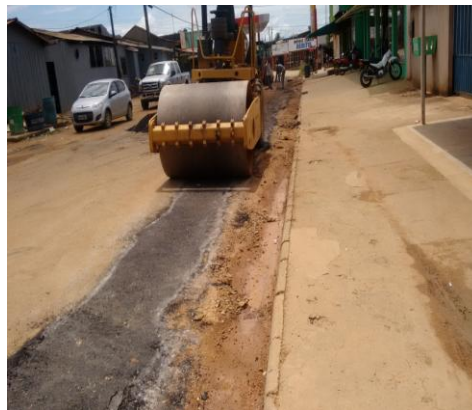
Foto 05. Utilização do rolo compactador para aplicação da massa PMF.