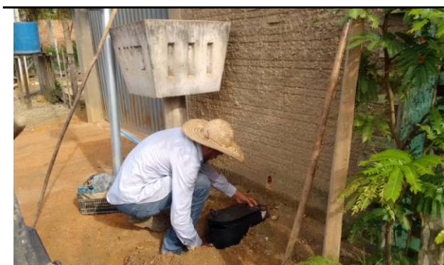
Foto 01: instalação realizado pela prestadora de serviço da CONCESSIONÁRIA ÁGUAS DE BURITIS S/A.